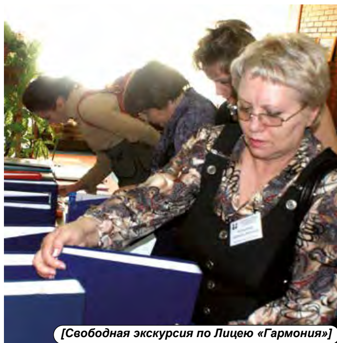
[Свободная экскурсия по Лицею «Гармония»]