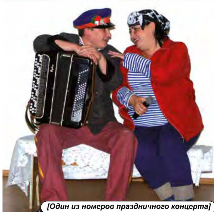
[Один из номеров праздничного концерта]