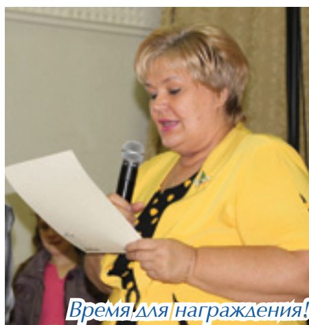
Время для награждения!