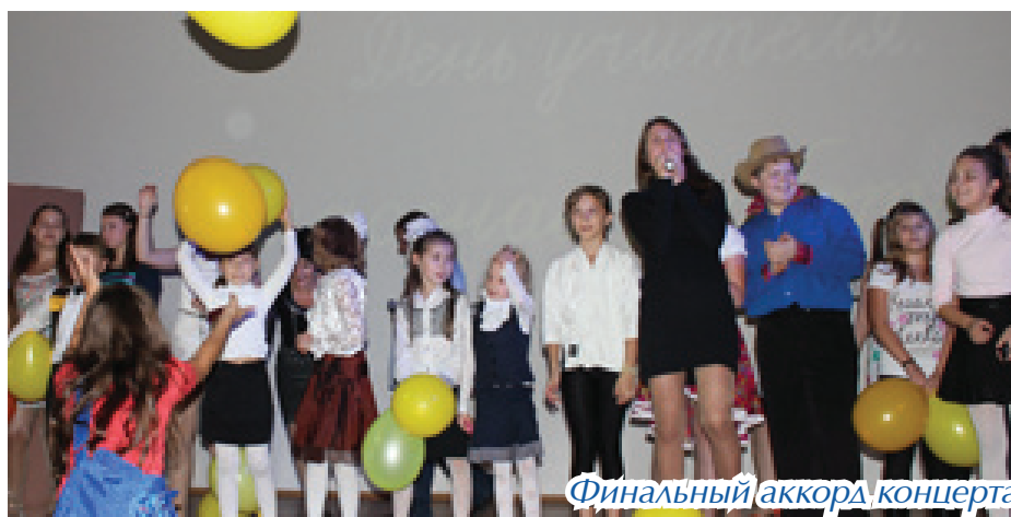
Финальный аккорд концерта