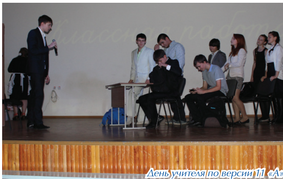
День учителя по версии 11 «А»