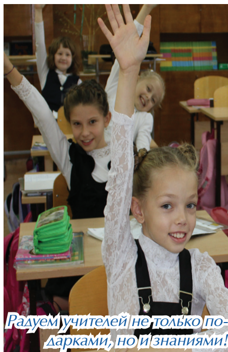
Радует учителей не только подарками, но и знаниями!