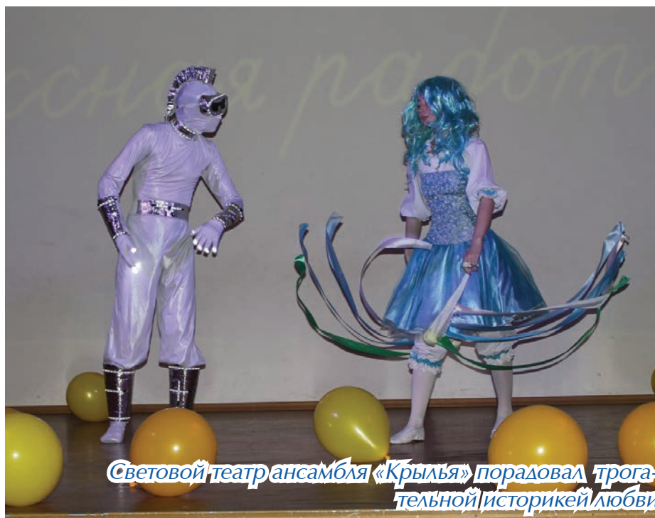
Световой театр ансамбля «Крылья» порадовал трогательной историей любви