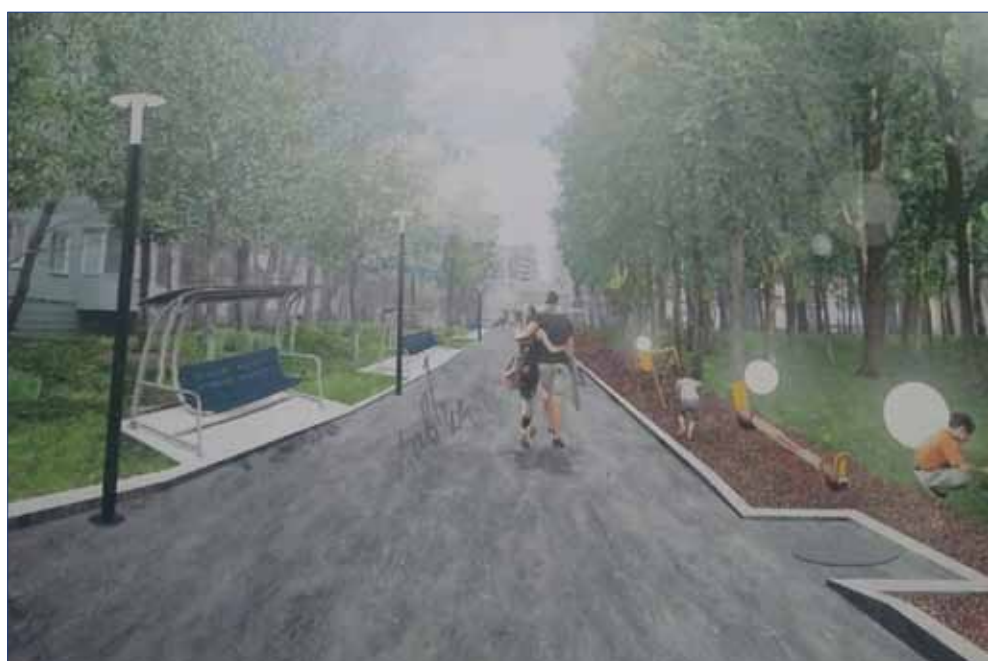
будущее Ленинградского проспекта.