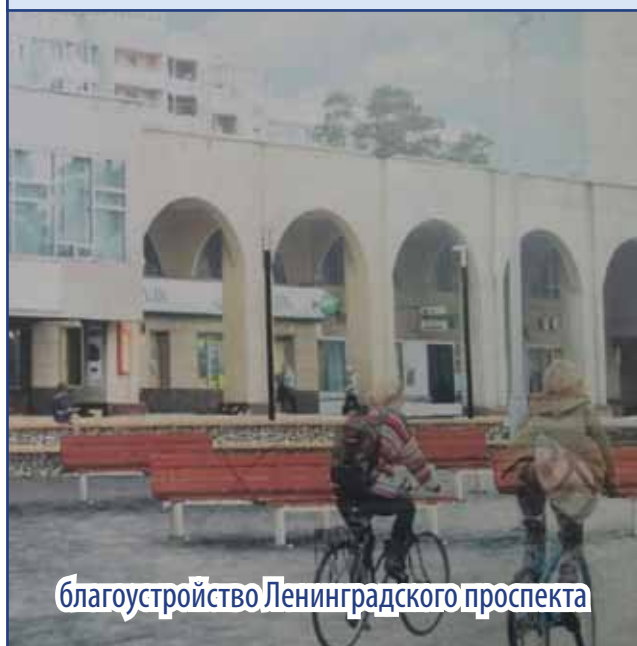
благоустройство Ленинградского проспекта