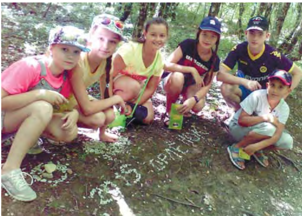
дети из городов Росатома в ВДЦ «Орленок», 2015 год