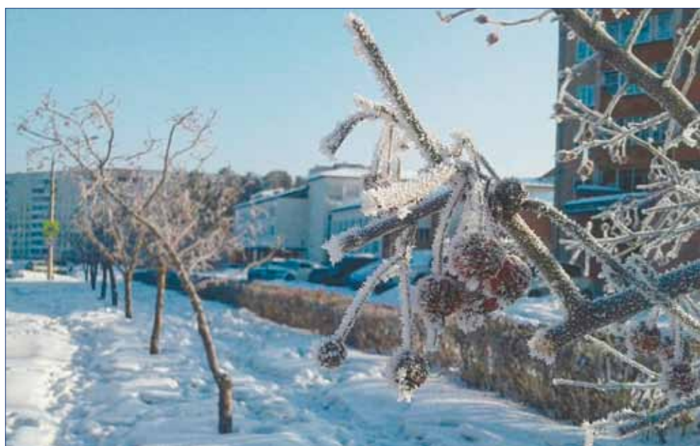
По дороге в школу