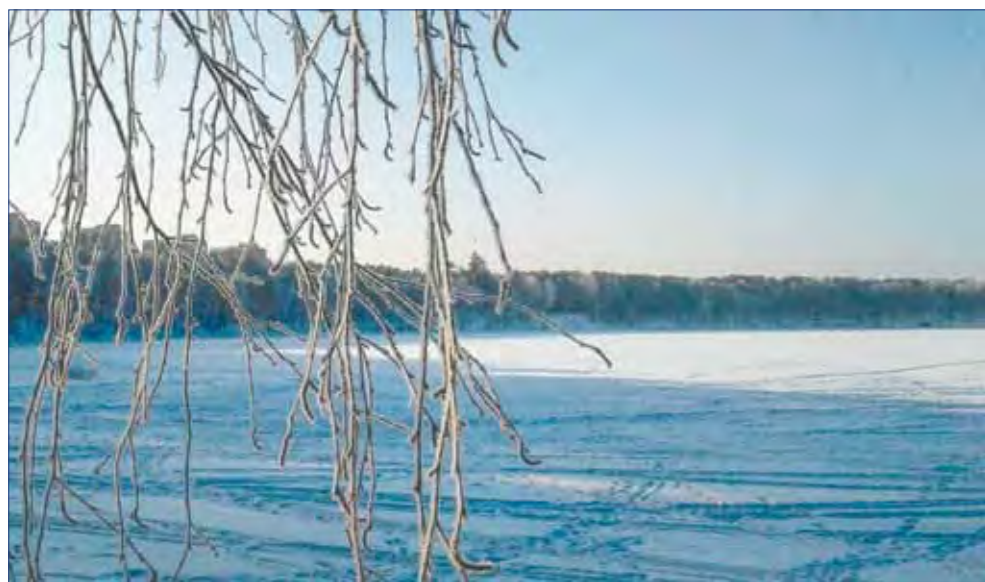
Тихий звон колоколов...