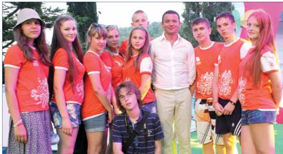
участники смены «Росатома» с президентом международного конкурса-фестиваля «Цветик-семицветик» актером и телеведущим Александром Олешко, ВДЦ «Орлёнок», 2013 г.