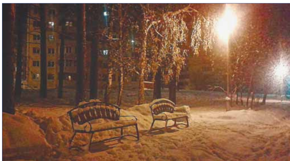
Поздний вечер. Тишина...